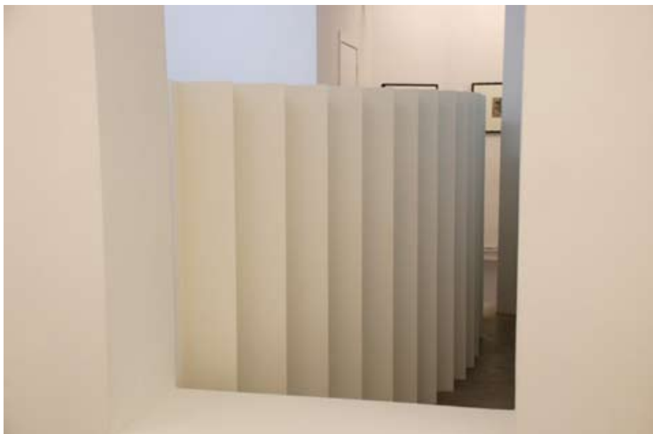
Zig zag , Galerie Sébastien Ricou Bruxelles, 2010 2 murs courbes en médium peint en blanc, 150x400x27cm chacun