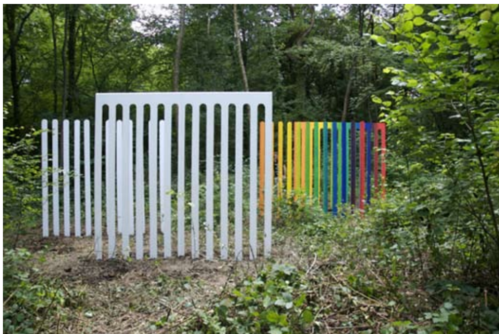
Palissades , Le vent des Forêts 2008 Installation in situ, 4 structures en bois 2.5mx3mx3cm, peinture blanche, peinture dégradée de couleur