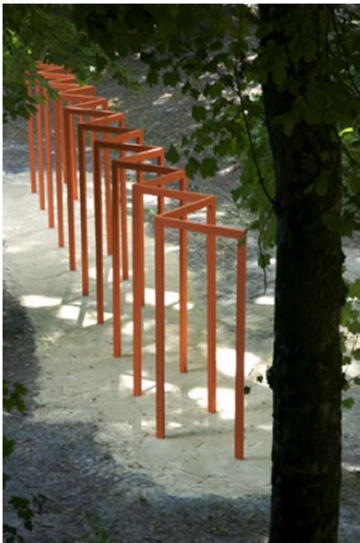
Torii , installation in-situ dans le parc Baron, Fontenay Le Comte, bois peint en orange 9x2.5x1m, 2008

carolerivalin@yahoo.fr - http://www.carolerivalin.com