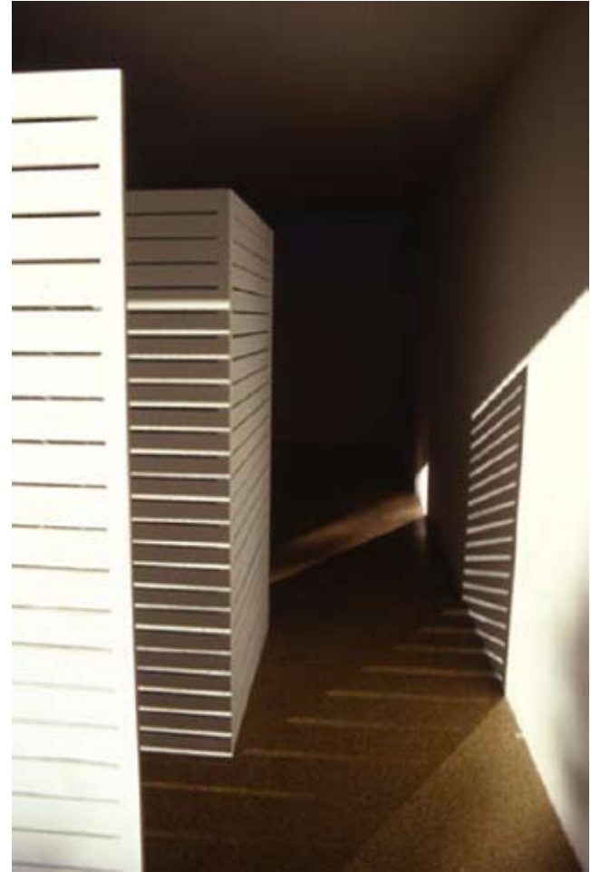
Dispositifs de 4 panneaux rainurés en contreplaqués de 1200x2000cm assemblés et peints en blanc Présentation de la résidence à l'Espace de l'Art Concret, 2004